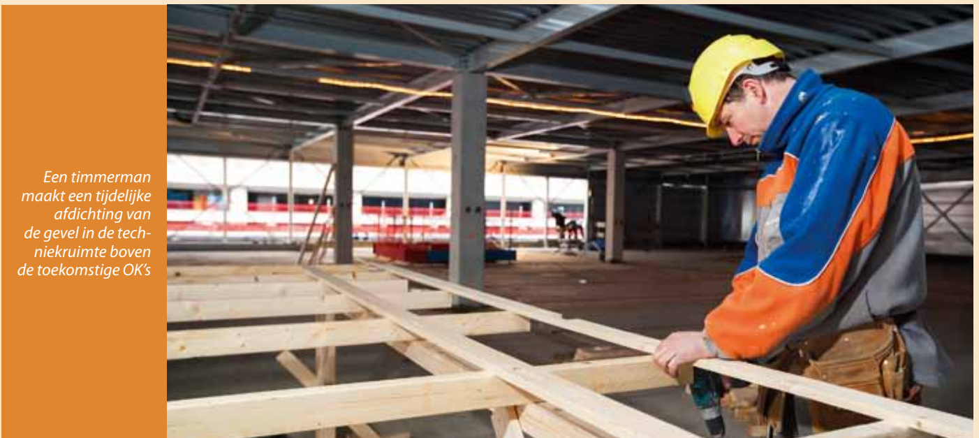
Een timmerman maakt een tijdelijke afdichting van de gevel in de techniekruimte boven de toekomstige OK's