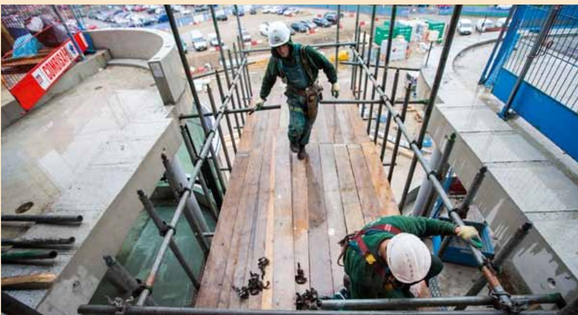
Steigerbouwers bouwen een bevoorradingssteiger voor de bouwlift