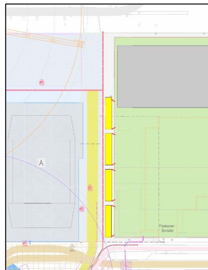
Afbeelding: plaatsing voetgangersportaal Turfhaven

Bij het plaatsen van het voetgangersportaal wordt gebruik gemaakt van een mobiele kraan. Gedurende deze werkzaamheden zijn er verkeersregelaars aanwezig om het fiets- en voetgangersverkeer te begeleiden. Het plaatsen van het voetgangersportaal neemt 1 werkdag in beslag.