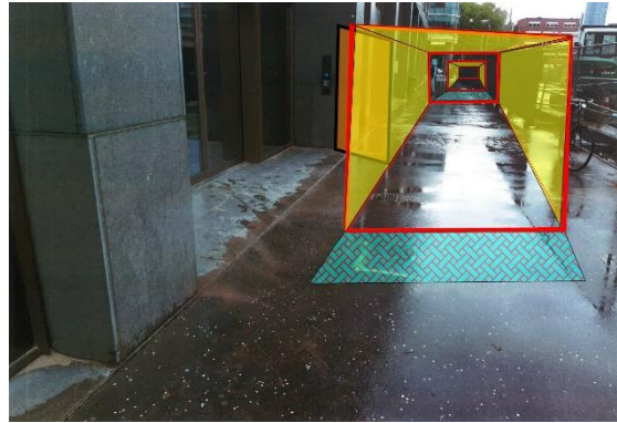
Afbeelding: Zijde Turfmarkt